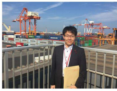
仙台港コンテナターミナル視察