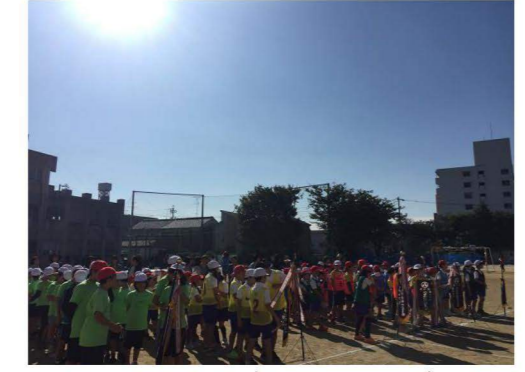
子ども会の運動会