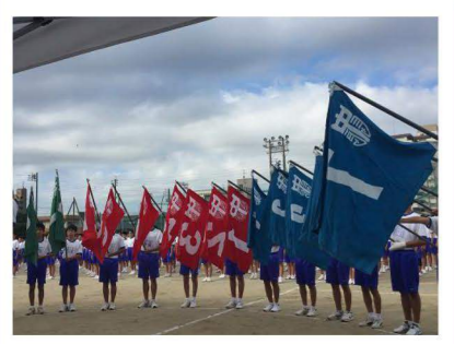
母校長良中学校運動会