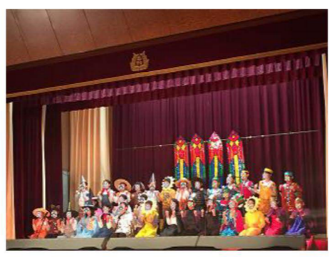
母校愛知小学校学芸会