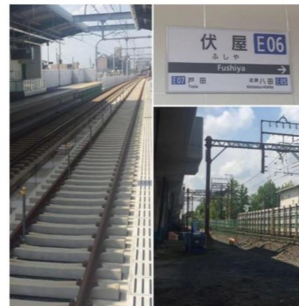
近鉄伏屋駅の高架化の様子

「ささしまライブ」から「金城ふ頭」を船で結ぶ中川運河の水上交通として10月8日に運航開始しました。