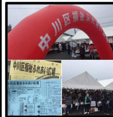
福祉ふれあい広場