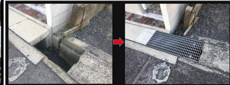
安全・安心なまちづくり